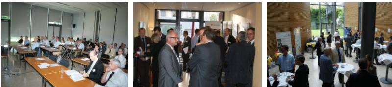
Juni 2010 Karlsruhe