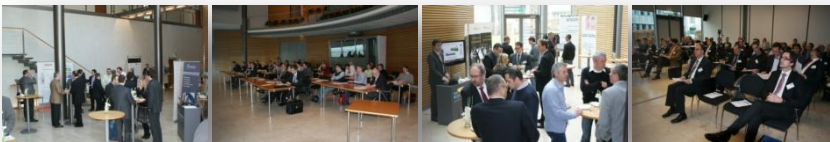
Bilder des RemoteServiceForum vom 22.-24. Februar 2011 Remote Technology, Remote Security, Remote Services

Neue Technologien und Businessmodelle mit strukturierten Sicherheitskonzepten kombinieren – die Branchen beginnen, voneinander zu lernen.