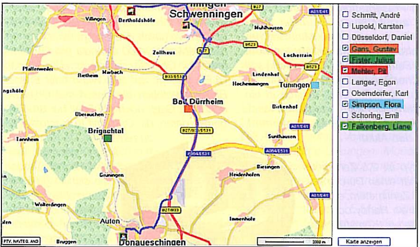
Optimierte Einsatzplanung mit Routenoptimierung/Lokalisierung

auftrag verbunden. Die Kommunikation wird ohne manuelle Zwischenschritte in das ERP-System eingestellt, wo auch die Bestandverwaltung abläuft, und löst dort die entsprechenden Geschäftsprozesse aus.